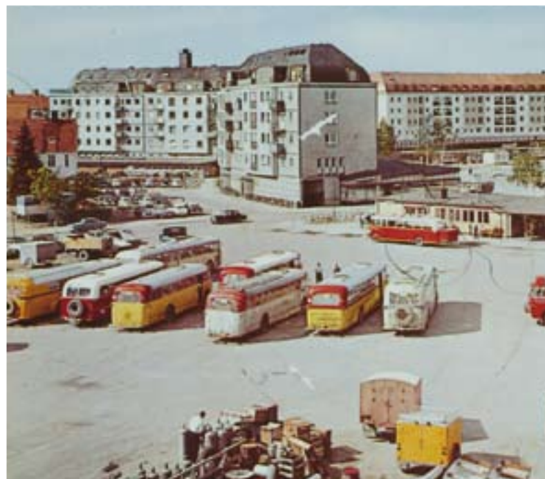
Busstationen i slutet av 50-talet – som den såg ut när Sixten Landby imponerade på det unga Umeå genom att lyfta sin cykel på ett finger.