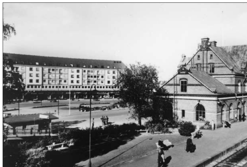
Kring parkbänken vid viadukten har många människoöden passerat revy.

Tittar han någon gång ner på sin gamla hemstad, ska han upptäcka att alla gamla original – med sin originella egenheter – har försvunnit.